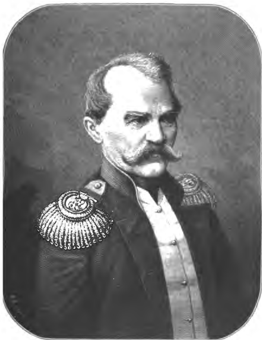
ГЕНЕРАЛЪ-АДЪЮТАНТЪ ВЛАДИМІРЪ ИВАНОВИЧЪ НАЗИМОВЪ РОД. 1802 † 1874 г.