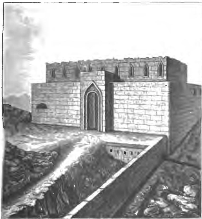
БАЯЗЕТЪ. ПЕРЕДНИЙ ФАСЪ ЦИТАДЕЛИ ВЪ 1877 г.