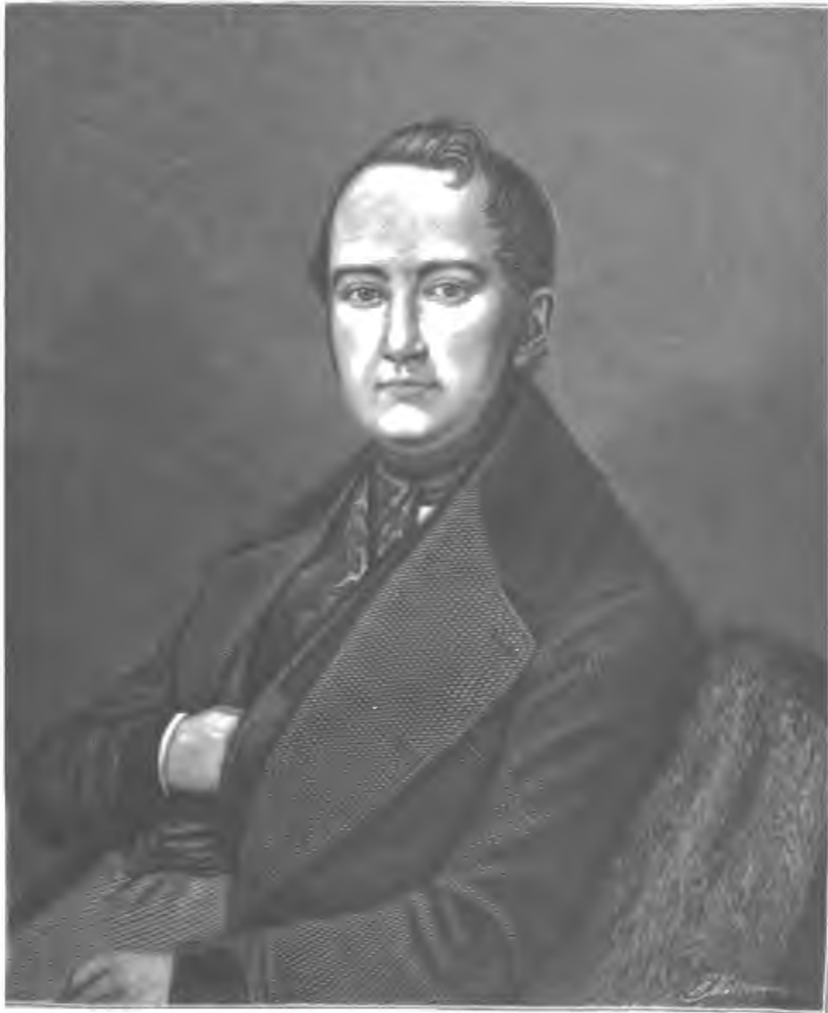
АНДРЕЙ ИВАНОВИЧЪ ПОДОЛИНСКІЙ