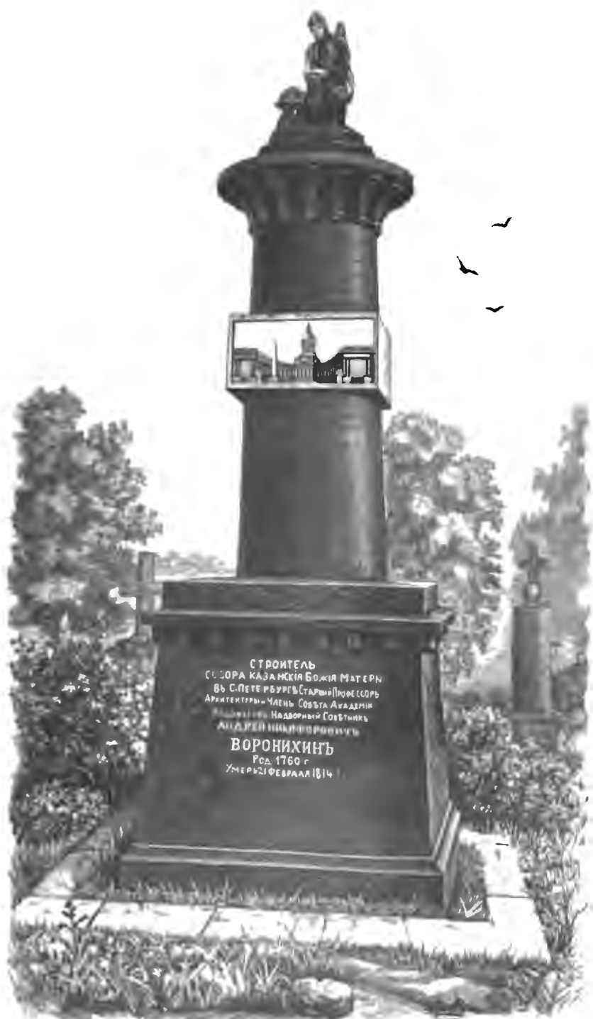
ПАМЯТНИКЪ НА МОГИЛѢ ВОРОНИХИНА, СТРОИТЕЛЯ КАЗАНСКАГО ВЪ С.-ПЕТЕРБУРГѢ СОВОРА.